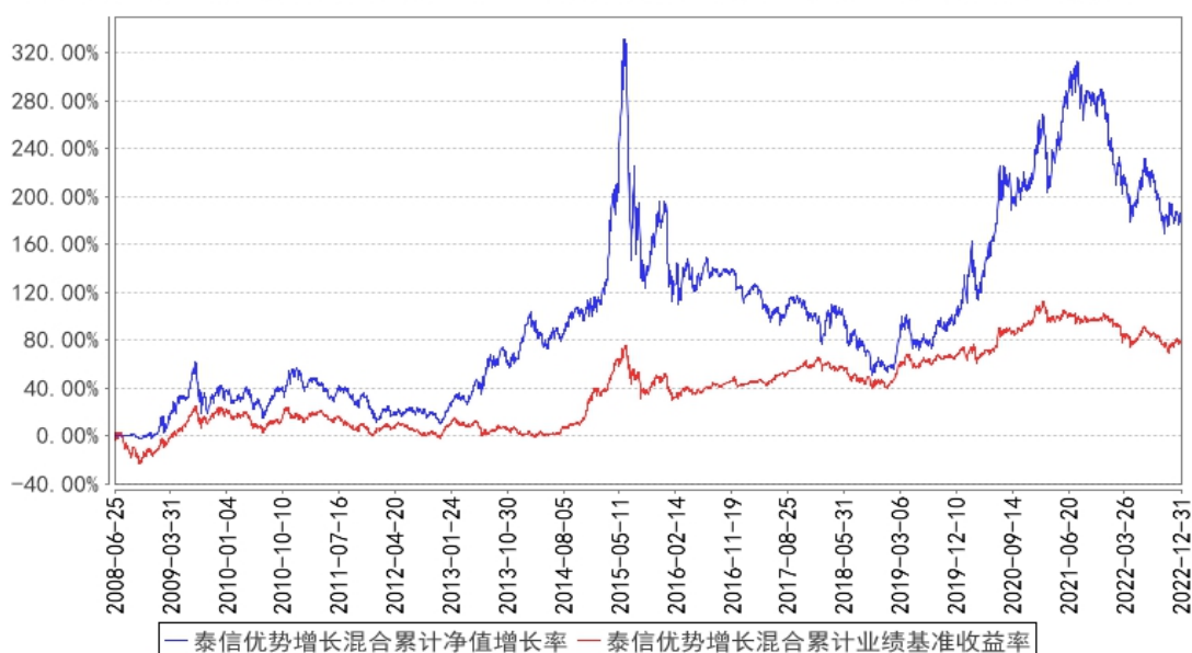
泰信优势增长混合累计净值增长率与同期业绩比较基准收益率的历史走势对比图