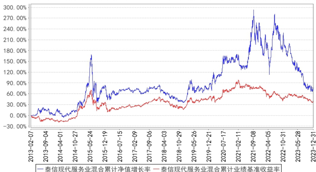
泰信现代服务业混合累计净值增长率与同期业绩比较基准收益率的历史走势对比图

注：1、本基金合同于 2013 年 2 月 7 日正式生效。本基金自 2015 年 8 月 7 日起变更为混合型基金。